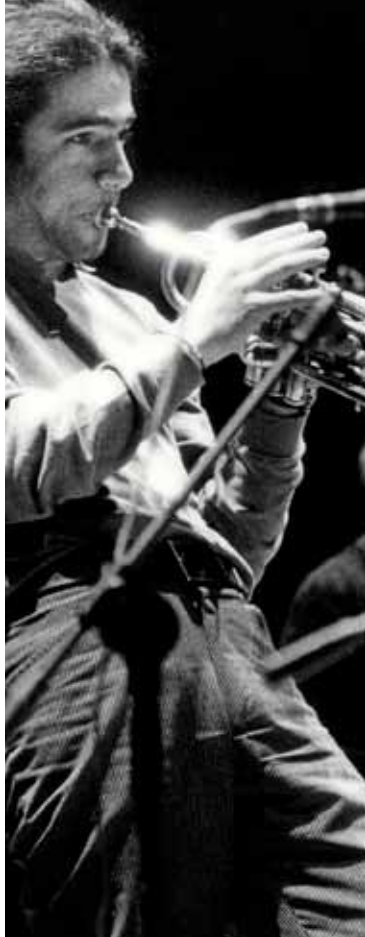
Paolo Fresu