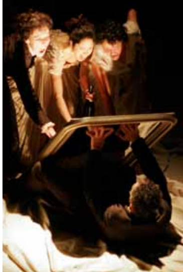
«Last Touch First»