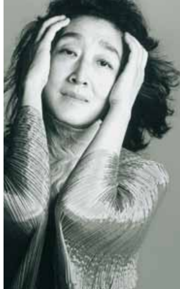
Mitsuko Uchida