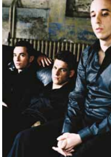
Quatuor Ebène

Lundi / Montag / Monday 28.09.2009 20:00 • Jazz