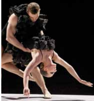
«3xBoléro» / OreloB

Samedi / Samstag / Saturday 31.10.2009 20:00 • Dance