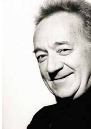
Yuri Temirkanov