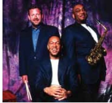
Clayton-Hamilton Jazz Orchestra