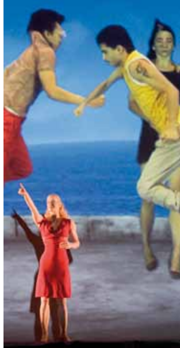
«Good Morning, Mr. Gershwin»

Extraits audiovisuels sur www.philharmonie.lu