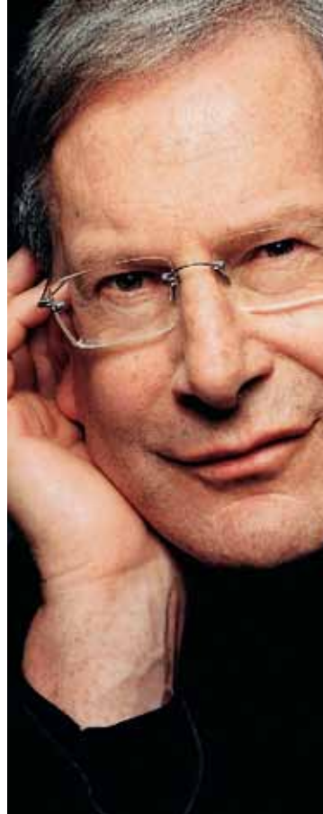
Sir John Eliot Gardiner

Tickets: 20 € (tarif jeunes <26 ans: 8 €) – ☎ (+352) 47 08 95-1