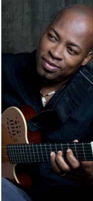
Lionel Loueke