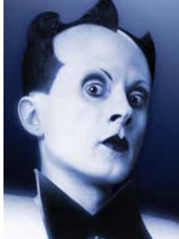
Klaus Nomi