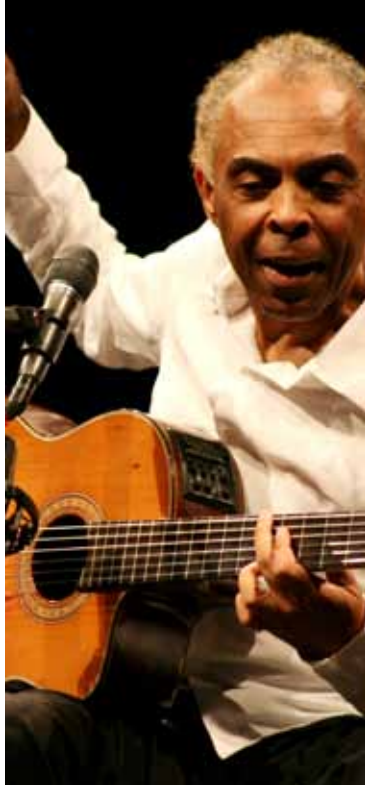
Gilberto Gil