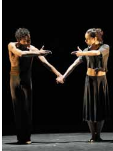
«Four Play» / Björk Duets

Tickets: 15 / 20 / 25 € (tarif jeunes <26 ans: 8 €) – ☎ (+352) 47 08 95-1