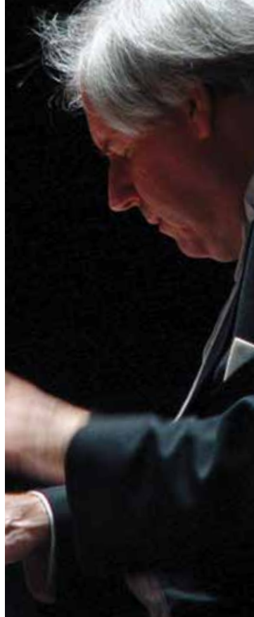
Grigory Sokolov