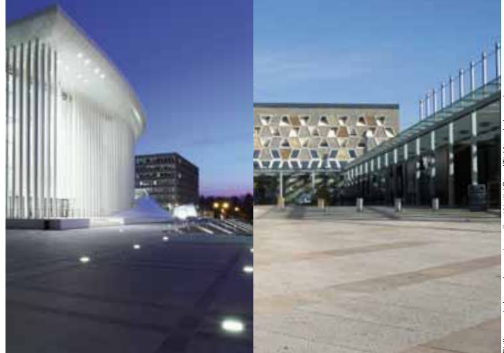
Philharmonie Luxembourg